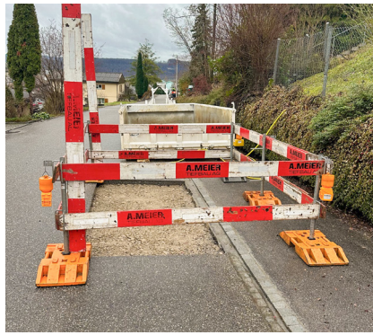
Eine instand gestellte Fläche nach repariertem Schaden. Als letzter Schritt wird diese asphaltiert.