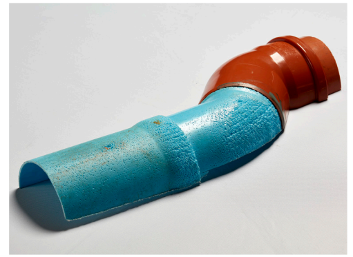
Grabenloser Leitungsbau: Bei der Inliner-Sanierung wird ein spezielles flexibles Rohr in das bestehende beschädigte Rohr eingeführt.