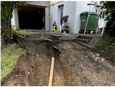
Offene Bauweise: Blick in einen Graben mit beschädigtem Rohrabschnitt.